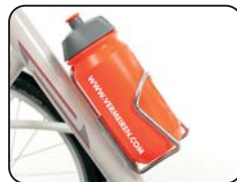
E7 - Porta borraccia (borraccia non inclusa)