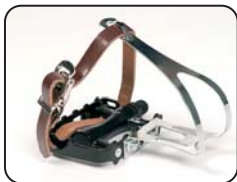
F2 - Pedali con cinghie a clip