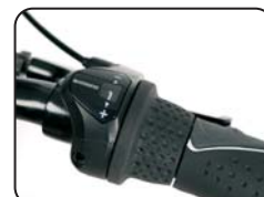
O7 - Cambio a 7 rapporti