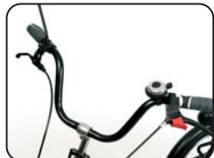
S1 - Manubrio ad U classico