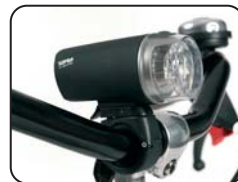
E2 - Kit luci anteriore posteriore