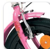
Sistema freni a V