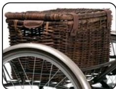
E4 - Cestino solo per modello Vintage