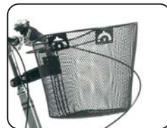
E14 - Cestino metallico anteriore