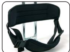
P1 - Supporto pelvico