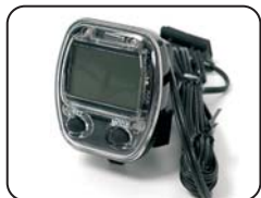
E3 - Contachilometri