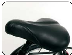
E12 - Sella comfort