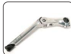
S5 - Staffa di sterzo regolabile