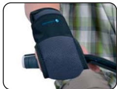
E11 - Guanto blocco mani