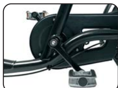
O1 - Pignone libero