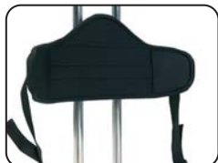
P2 - Supporto schiena