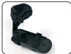
F4 - Appoggio piede con chiusura a velcro e supporto caviglia