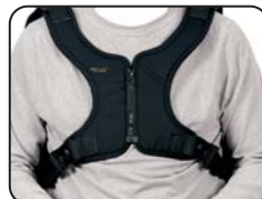
U73 - Cintura a gilet Neoflex