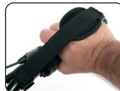
E9 - Cintura blocco mani