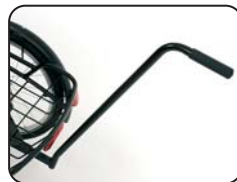
E1 - Maniglia di spinta