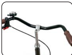
S3 - Manubrio tipo Citybike