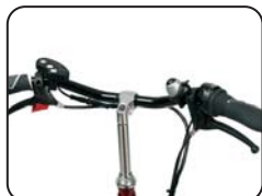
S2 - Manubrio ad V piatto