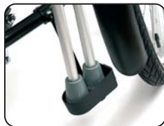
E6 - Porta stampelle