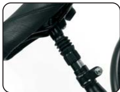
P5 - Tubo sella con ammortizzatore