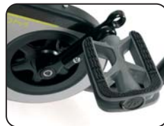
F5 - Pedali con lunghezza regolabile in 2 posizioni