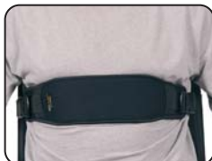
U80 - Fascia toracica Neoflex