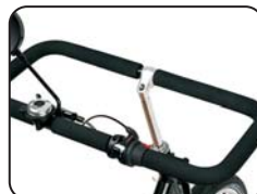
S4 - Manubrio rettangolare