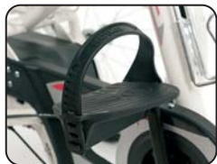
F1 - Pedali con cinghie