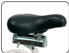
P4 - Sella regolabile in profondità