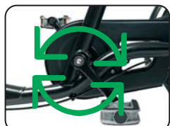
O6 - Pignone fisso