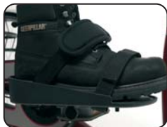
F3 - Appoggio piede con chiusura a velcro