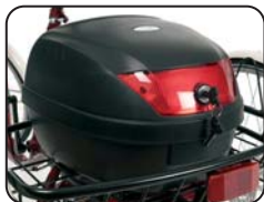
E5 - Bauletto