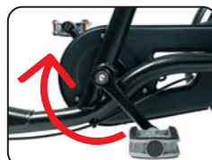
O2 - Freno a pedale