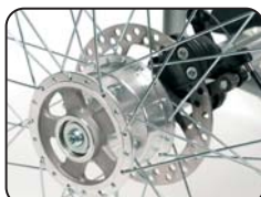
B1 - Freno a tamburo inserito nell'asse della ruota anteriore