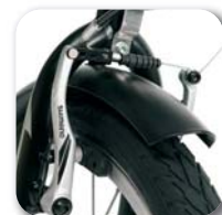
Sistema freni a V