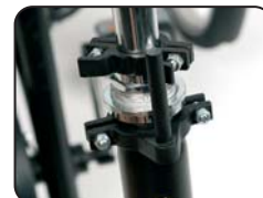
D1 - Blocco rotazione a 360°