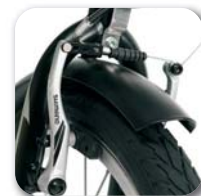
Sistema freni a V