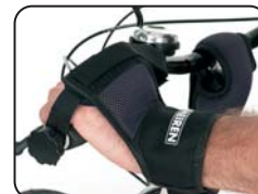
E10 - Cintura blocco mani